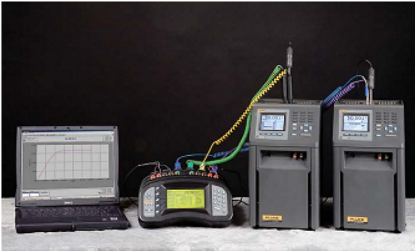
Slika: Potpuno povezani i automatizirani sustav za umjeravanje termometara u MetroLab-u

Software HART Sci. MET TEMP II upravlja temperaturnim izvorima, te se unaprijed definiraju temperaturne točke u kojima će se termometar umjeravati. Za svaku se točku umjeravanja određuje preciznost i stalnost koje moraju biti zadovoljene, prije nego što se započne sa akvizicijom rezultata umjeravanja. Software tada naizmjenično pohranjuje rezultate etalona i umjeravanog termometra, te bilježi standardnu devijaciju rezultata.